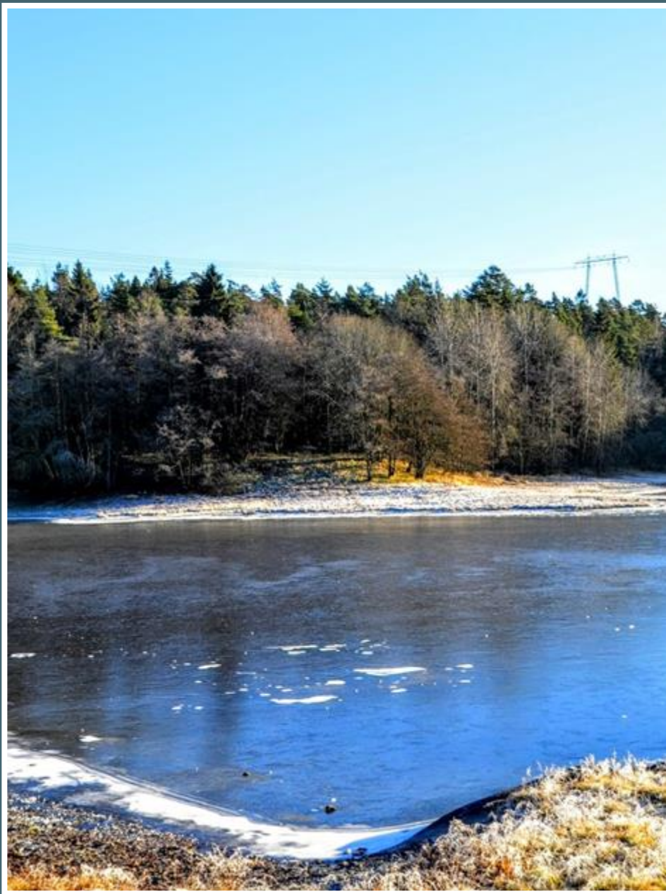
Hustomta på Moen sett fra Kalvetangen