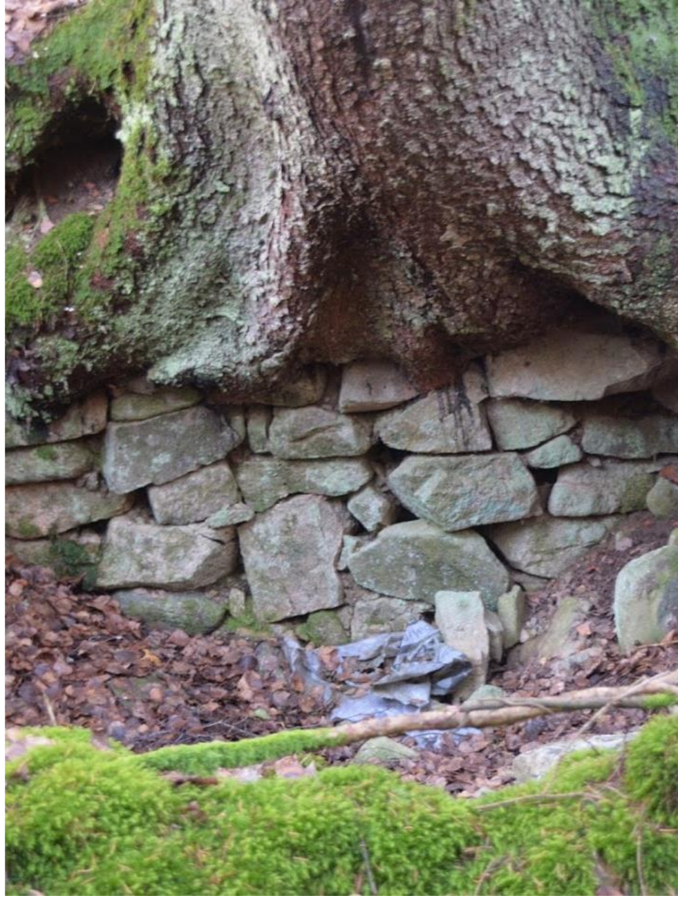
Bilde: Fra hovedhuset vi ser rester av kjelleren

Man kan se tydelige rester av kjelleren under en stor gran. Edmund Kingsrød fortalte at de gjemte poteter i denne kjelleren under siste krig .