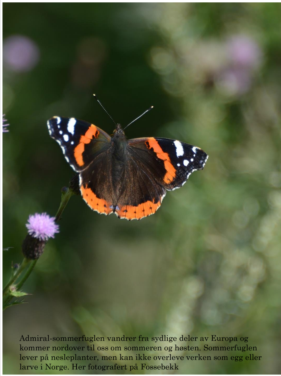
Admiral-sommerfuglen vandrer fra sydlige deler av Europa og kommer nordover til oss om sommeren og høsten. Sommerfuglen lever på nesleplanter, men kan ikke overleve verken som egg eller larve i Norge. Her fotografert på Fossebekk