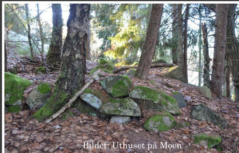
Bildet: Uthuset på Moen